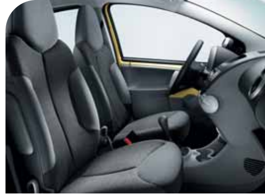
C & T Transcodage Kumaş - Siyah / Gri