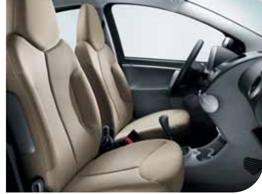
C & T Transcodage Kumaş - Bej